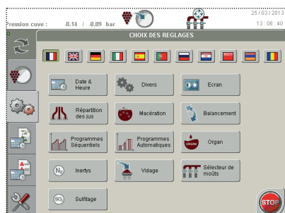
Automate Bucher ICS